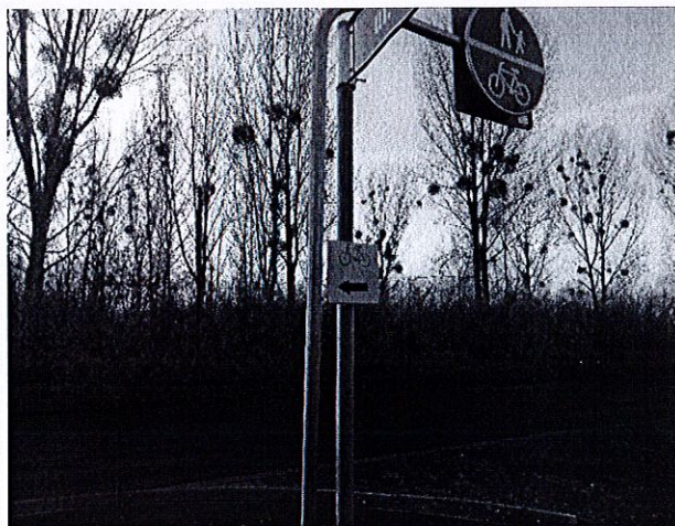
Miejsce/kierunek proponowanego odcinka ścieżki rowerowej